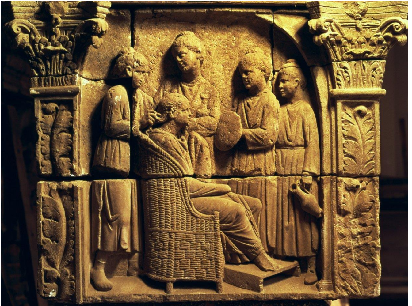
Acconciatura di matrona , rilievo in marmo, II sec. d.C.

La padrona di casa è seduta su una poltrona di vimini, mentre quattro giovani ancelle le acconciano i capelli: dietro di lei una la pettina, mentre una tiene uno specchio davanti a lei; le altre due portano recipienti per oli profumati.